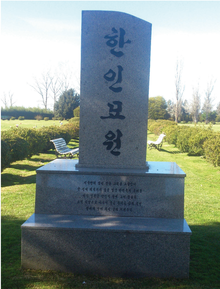
Figura 1. Monolito. (Cañuelas, 2016)

Adoptando estas tierras tan diferentes a su país que añora/ los descendientes del pueblo coreano que trabajaron el sueño del pionero durante toda su vida/ duermen en paz acá, tierra de descanso eterno/ lugar de nuestras vidas que se fue edificando únicamente con la esperanza/ convertidos en estrellas de la Pampa, serán nuestros firmes protectores. 11