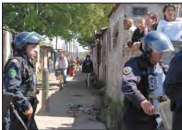
Imagen 11. La Policía bonaerense en el allanamiento a una villa en Ciudad Evita (Página 12, 5/11/2008).

poner esa imagen en relación con otras fotografías con las que creemos que forma serie y que se presentan a continuación: