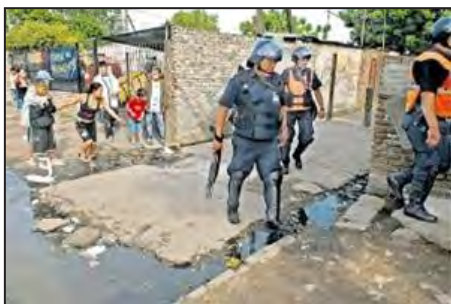
Imagen 12. Los allanamientos de ayer en la villa Puerta de Hierro, en La Matanza. Foto: Telam (La Nación, 05/11/2008).