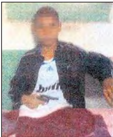
Imagen 15. “Sospechoso de 16 años. Otro de los acusados, en una foto sacada con un celular, empuña un revólver calibre 22”. La Nación , 26 de octubre de 2008.

En ambas fotografías vemos a dos sujetos masculinos, mirando a cámara, vestidos con ropa deportiva, y portando armas. Los epígrafes refuerzan los significantes vinculados a la dimensión etaria de estos “jóvenes” y a la portación de armas: “Sospechoso de 18 años. El imputado, en una foto tomada con su celular, con una ametralladora marca UZI”; “Sospechoso de 16 años. Otro de los acusados, en una foto sacada con un celular, empuña un revólver calibre 22”. Esta operación de estabilización de los significantes visuales se articula con el sentido construido en la mayoría de los cuerpos textuales: se presenta a estos personajes como salidos de una película de gánsteres, haciéndose especial hincapié en sus niveles de peligrosidad y dando cuenta de cuan “pesados” son estos sujetos. Un claro ejemplo de ello es la tapa del 15 de noviembre de 2009 de La Nación que titula: “Hábitos y códigos de la banda que asaltó y asesinó al ingeniero: consumen ‘paco’ y ‘aceto’ una especie de cocaína rebajada que compran por catorce pesos (...) les gusta exhibir sus armas. Se sacan 28 fotos con sus teléfonos celulares posando con ametralladoras UZI, pistolas calibre 45 y revólveres calibre 22 (...) quince días antes del homicidio de Barrenechea, el menor identificado como B. fue apresado cuando robaba en una casa con un cómplice. Un juez de San Martín lo liberó” ( La Nación , 15/11/08. Nota de tapa).