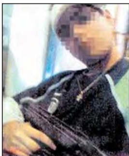
Imagen 14. “Sospechoso de 18 años. El imputado, en una foto tomada con su celular, con una ametralladora marca UZI. La Nación , 26 de octubre de 2008.

El 26 de octubre de 2008, La Nación titula: “Revelan como mataron al ingeniero”, con la siguiente volanta: “Inseguridad: las declaraciones de los imputados del homicidio de Acasusso”. Y las imágenes que se publican son las siguientes: