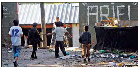
Imagen 7. “La puerta: desde aquí se ingresa a la villa” ( Clarín , 26 de octubre de 2008).