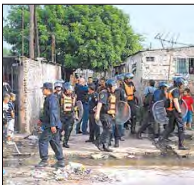
Imagen 13. Allanamiento. La villa Puerta de Hierro donde vivía el joven fugado (Clarín, 11/11/2008).