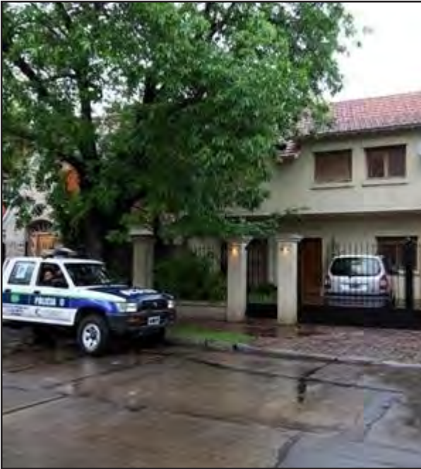
Imagen 10. “El ingeniero fue abordado por los delincuentes en la puerta de su casa”. Foto: Ricardo Pristupluk ( Página 12 , 23/10/2008).

En ambas imágenes, muy similares entre sí, los elementos que observamos son: una casa de dos pisos, con un auto en su interior, separada de la vereda por unas rejas negras y una camioneta policial estacionada en la puerta de la misma. En ambas imágenes se incluye el móvil policial en el cuadro. Si introducimos en el análisis los epígrafes, aquello que aparece como primer plano en ambas imágenes resulta completamente invisibilizado: nos referimos a la presencia policial, ya que el texto pone en primer plano los significantes “casa” e “ingeniero” (o profesional). El pie de las fotografías entonces estabiliza una imagen connotada de antemano: allí el móvil policial está “de visita”, no es la noticia, estaciona en el cordón de un chalet de Acassuso, no es el vehículo policial donde se hace foco sino en aquello que motiva su presencia allí —el asesinato del ingeniero—, y podríamos agregar que no cualquier presencia, sino una presencia silenciosa, una presencia visual que no necesita de texto para ser comprendida y que se vincula a un sentido común sedimentado en relación a un modo del “estar” de las fuerzas de seguridad en ese territorio.