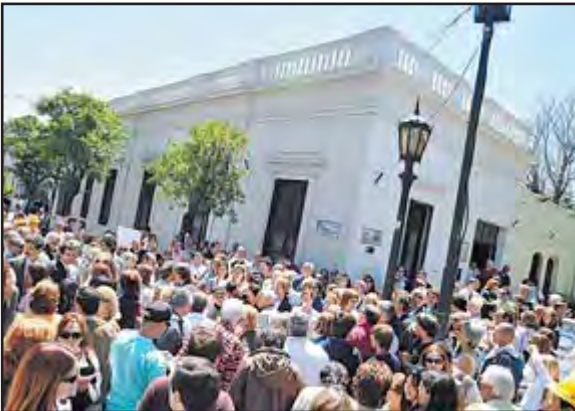
Imagen 5. Preocupación. Los vecinos caminaron y pidieron “que los jueces que no larguen más a los delincuentes” ( Clarín , 23 octubre de 2008).

Titular: “Marcha con vecinos indignados”