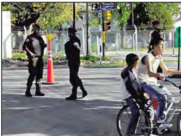
Imagen 6. Sin epígrafe ( Clarín , 23 octubre de 2008).

El tercer titular sin fotografía es el siguiente: “Scioli quiere bajar la edad para imputar a los menores”.