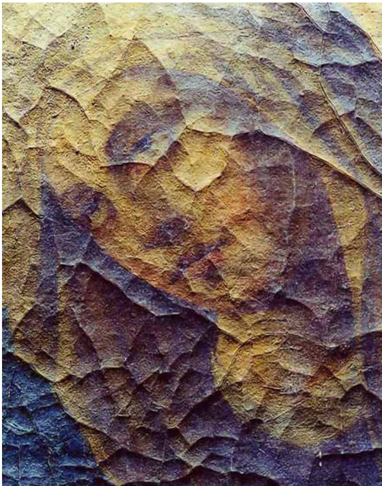
Figura 1. Craquelado de un lienzo del siglo XVIII donde se representa una imagen de la Piedad .

aquí el término “objetiva” se emplea en el sentido de que “no tiene nada que ver con el origen y creación de la obra, con su esencia original”. 28 Esto enlazaría con el discurso planteado anteriormente, que vinculaba lo “objetivo” con lo “originario”, e implicaba borrar toda alteración física sufrida en el tiempo. No obstante, cabría objetar que las lagunas forman parte de la obra al igual que la propia materia “originaria” y, precisamente, estas sí constituyen una realidad “objetiva” en la medida en que