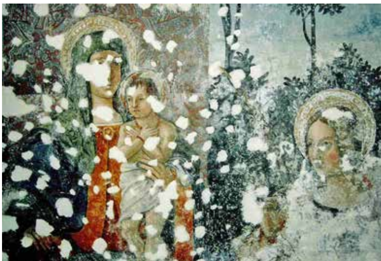
Figura 2. Daños en una pintura mural de la Pieve di Santa Maria Assunta , Condino (Trento, Italia).

condicionantes de cada sociedad y de cada momento histórico. Desde este prisma, la intervención no puede fundamentarse en procedimientos sistemáticos generalizados, sino que requerirá una reflexión crítica que permita poner en práctica la metodología más oportuna en cada caso concreto. Así lo confirma el siguiente testimonio: