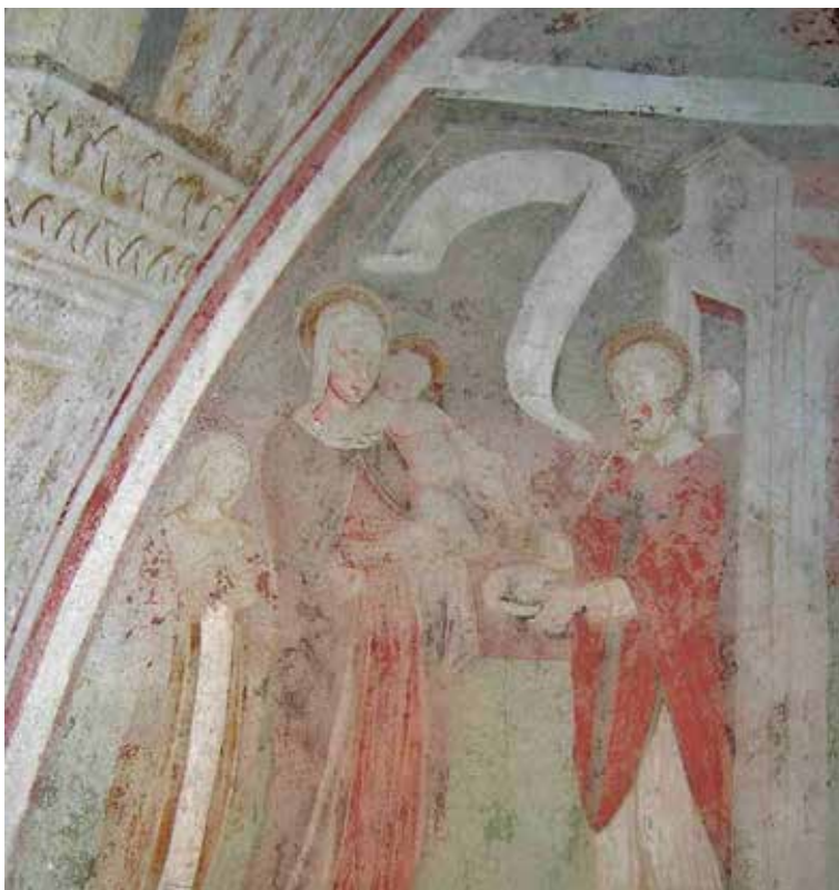
Figura 6. Detalle de una reintegración mural hecha a sotto tono .

reversibilidad de los materiales utilizados en la restauración, o la mínima intervención) gozan de la misma aceptación. Sin duda, de todos ellos, el más debatido es el de la reversibilidad, al discutirse la posibilidad de eliminar por completo los materiales aplicados y que la obra pueda volver a “recuperar” su aspecto previo a la intervención. 59 Hasta tal punto que algunos llegan a preguntarse: “¿A qué llamamos reversibilidad? Me parece que es una utopía dentro de la restauración”. 60