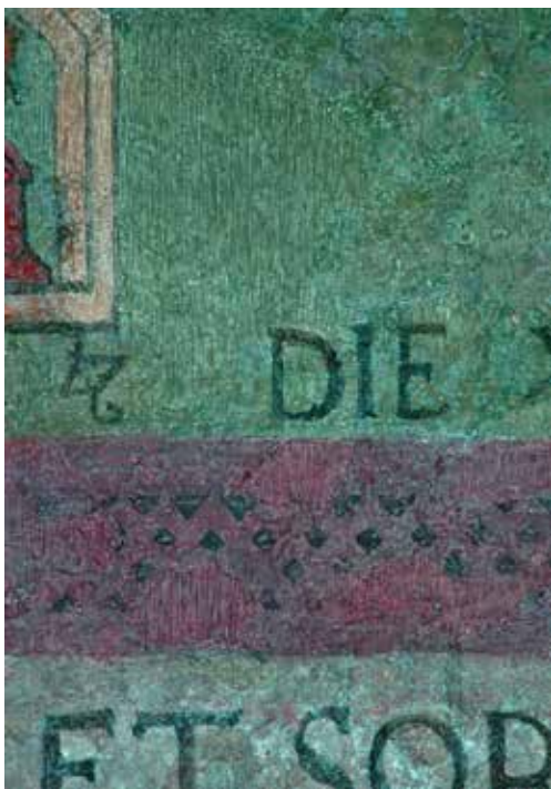
Figura 5. Detalle de una reintegración mural con tratteggio .