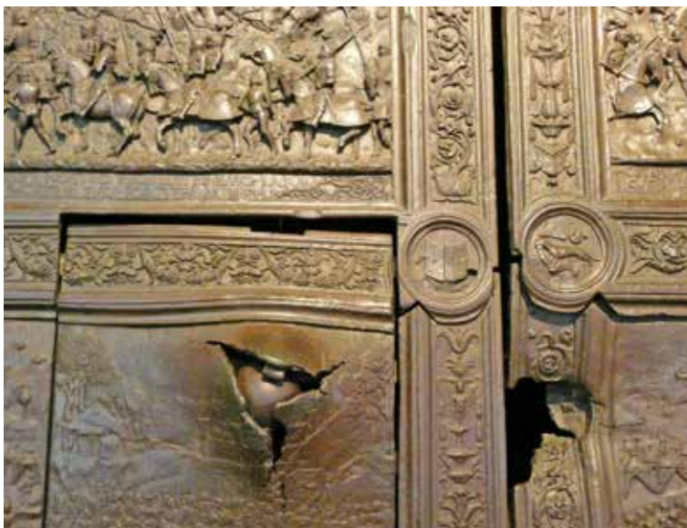
Figura 4. Detalle de las lagunas y de la bala de cañón incrustada en uno de los paneles de la puerta de acceso a Castel Nuovo (Nápoles, Italia).

no se plantean desde un principio y se tienen presentes durante el transcurso de la intervención, la restauración se concibe entonces en términos absolutos e incuestionables. Sin embargo, la ciencia es “constitutivamente social” 33 y ofrece siempre una versión de las “certezas”. De ahí que consideremos que la restauración debe implicar siempre una lectura interrogativa. Así lo reflexionan algunos autores: