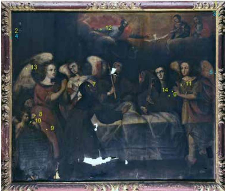
Figura 5. Muerte de Santa Teresa . El punto 13 indica la muestra en estudio.