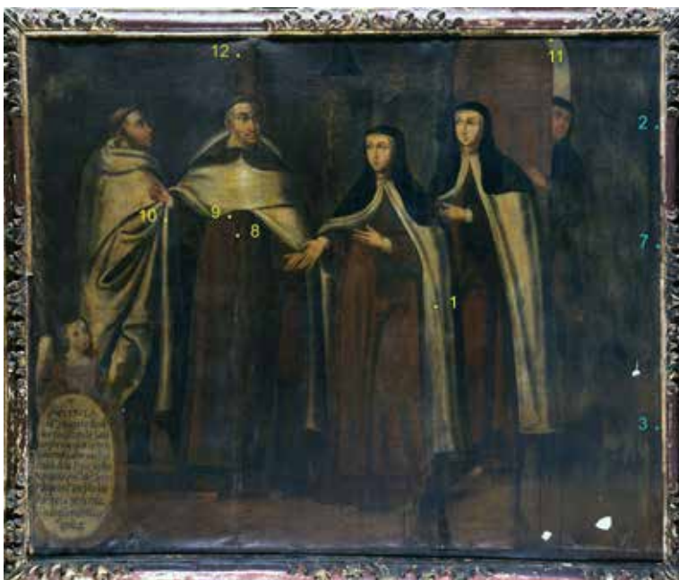
Figura 3. La Reforma del Carmen . El punto 12 indica la muestra en estudio.

La relación de abundancia de ácido palmítico sobre ácido esteárico (P/S) fue 1,17, por lo cual el perfil de ácidos grasos señala la presencia de aceite de linaza.