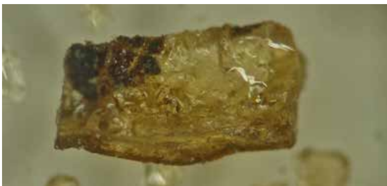
Figura 4. Muestra bajo lupa binocular.