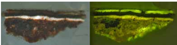
Figura 1. La Intercesión por Bernardino Mendoza. Corte estratigráfico bajo luz polarizada (izquierda) y bajo fluorescencia (derecha), ejemplo de resinato de cobre.

señales del espectro. Sin embargo, la técnica SERS (Surface-Enhanced Raman Spectroscopy), que usa la interacción metal-molécula para aumentar la relación señal/fluorescencia, está comenzando a investigarse para el campo de los bienes culturales. 25 Una nueva promesa de la química analítica.