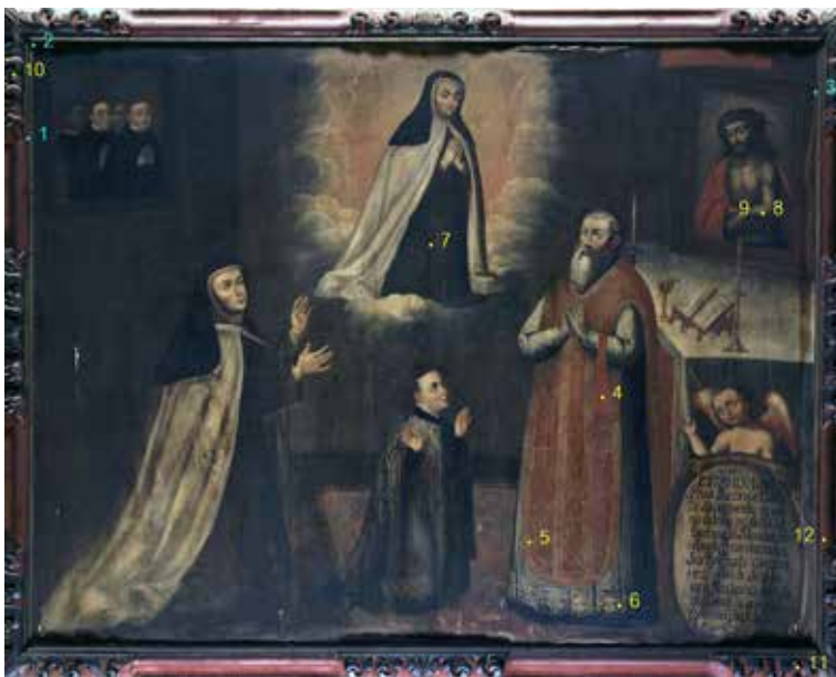
Figura 8. Éxtasis ante el obispo de Ávila . El punto 6 indica la muestra en estudio.