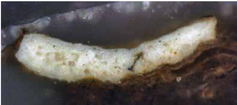
Figura 6. Corte estratigráfico de un fragmento de la muestra 13.

muestra problema a los de los patrones conocidos. PCA es un análisis estadístico de multivariantes, el cual combina linealmente 11 aminoácidos cuantificados en nuevas variables principales. Por lo tanto, PC1 y PC2 son representativos del comportamiento de los 11 aminoácidos. El gráfico en la figura 7 permite una comparación con clusters de huevo,