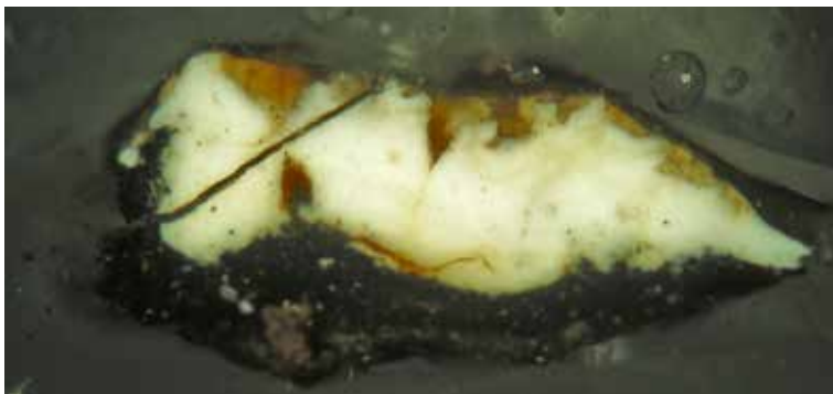
Figura 9. Corte estratigráfico de la muestra 06.