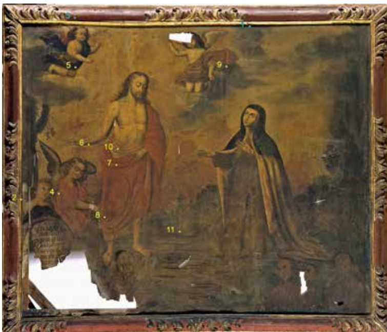
Figura 2. Intercesión por Bernardino Mendoza.

+/- 0.2), aceite de nuez (2.2 +/- 0.3), y huevo (2.4 +/- 0.3). Por lo que la muestra analizada contendría aceite de linaza. Colombini propone también calcular la razón A/P (azaleico/palmitico), pero el azaleico es un ácido dicarboxílico, y el método del INTA no los determina.