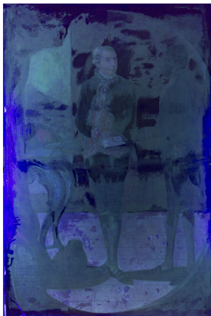
FIGURA 3. Fotografía de la fluorescencia UV durante el proceso de limpieza.