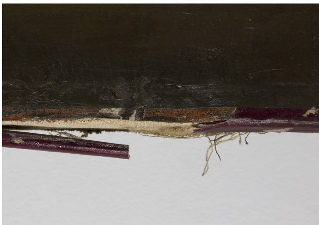
FIGURA 4. Detalle del papel perimetral, injertos, repintes y faltantes.