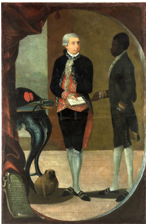
FIGURA 10. Fotografía final de la restauración.