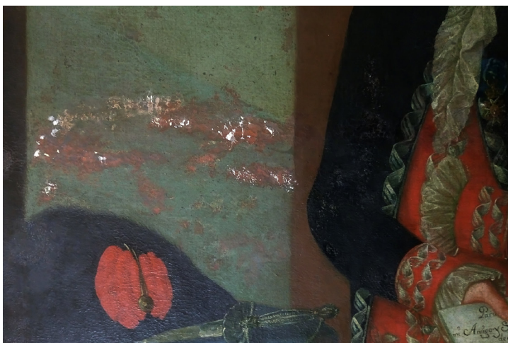
FIGURA 8. Eliminación de repintes en el paisaje y estucado de faltantes.

Posteriormente se sectorizó la limpieza y se planteó eliminar los repintes que, por sus características materiales, no eran afines con la pintura, y en muchos casos excesivos (figura 8). Las áreas comenzaron a ser tratadas por el perímetro y el suelo, los elementos ubicados en el lado izquierdo: el cortinado y la cartela, la mesa, los elementos sobre ella y el perro. Luego se procedió con el fondo de la pintura, el criado (de las rodillas hacia arriba), con Sanz (menos el rostro y las piernas), Por último se trabajó en ambos pares de piernas de los personajes y el rostro de Sanz (figura 9).