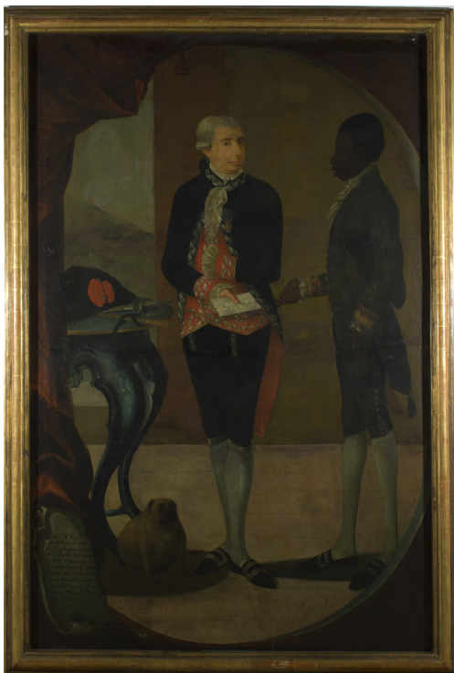
FIGURA 1. Retrato de Francisco de Paula Sanz, al momento de su llegada al taller, antes de comenzar la restauración.

Esta carta es entregada a un criado negro, vestido de librea, que acompaña a Sanz en el retrato. Vicente Fidel López en su libro, en 1852, describe que “El servicio de su casa era de un alto ceremonial: diez negros jóvenes vestidos de rigurosa etiqueta, centro blanco, calzón corto, medias con hebillas y amplia casaca color de grana, estaban siempre de centinela a su disposición”. 12 Esta descripción coincide con lo representado en el cuadro.