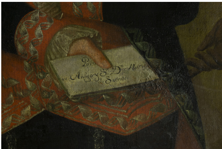
FIGURA 2. Detalle del craquelado, cazoletas, empastes y repintes en el sector central del cuadro antes de la restauración.

colonial. El sistema de anclaje de la tela es con tachuelas industriales que se encontraban oxidadas. Para finalizar, el marco de la obra presentaba grandes faltantes en las esquinas superior izquierda e inferior derecha.