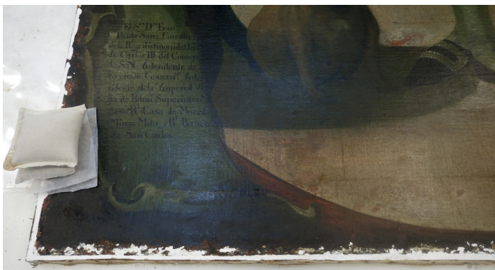
FIGURA 7. Estucado de faltantes en los bordes.