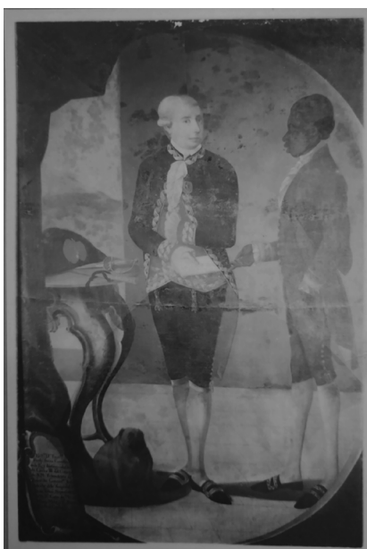
FIGURA 6. Reproducción de la fotografía del legado MHN 433.

Con el paso de los años, estos se transformaron en lo que hoy conocemos como Área de Conservación y Restauración del MHN . Si bien el avance y la profesionalización se desarrollaron de manera lenta en el país, y los criterios que se utilizaban antiguamente para intervenir el patrimonio distan de los actuales, el perfil de los restauradores pasó de artistas y artesanos a personas con formación académica y en talleres especializados.