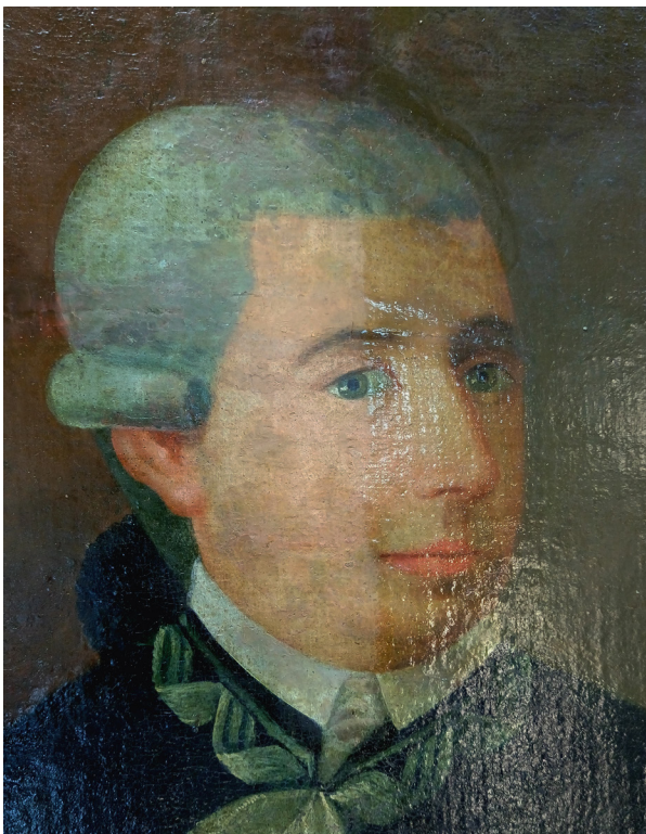
FIGURA 9. Remoción parcial del barniz en el rostro que deja al descubierto antiguos repintes.

con la misma disolución. Se utilizó un gel preparado con Klucel G(r) y alcohol bencílico, y bisturí en los sectores donde se encontraban muy endurecidos los agregados. Una vez retirados los repintes, se estucaron los faltantes y se retocó con acuarelas. Finalizados los sectores, se procedió a barnizar a pincel con dammar al 5% en las zonas con retoques. Luego se aplicó el mismo barniz con una concentración del 10% emparejando los brillos en todo el cuadro (figura 10).