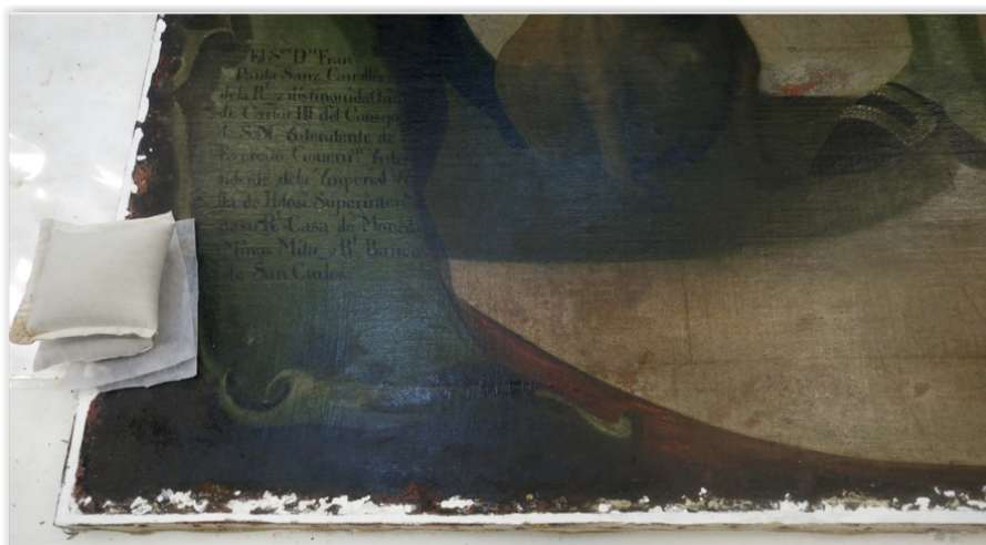
FIGURA 7 Estucado de faltantes en los bordes

Finalizada la documentación de la obra y delineada la propuesta de tratamiento, se llevó a cabo el desenmarcado para comenzar con una primera limpieza superficial con pinceleta de cerda suave y aspiradora. La segunda limpieza que se realizó fue una limpieza enzimática. Además, se eliminó una cinta de papel color violeta que estaba adherida a todo el contorno de la pintura, cuya función era disimular el sistema de sujeción y las tachuelas que unen la pintura con el bastidor. Esto provocó que se desprendieran muchos de los repintes que había en el perímetro, algunos incluso que se encontraban pintados por encima de este papel. Luego se procedió a la adhesión de los injertos perimetrales y a la nivelación mecánica, con bisturí, de los repintes y estucos que poseían estos agregados. Seguido de esto se estucaron los faltantes (Fig. 7).