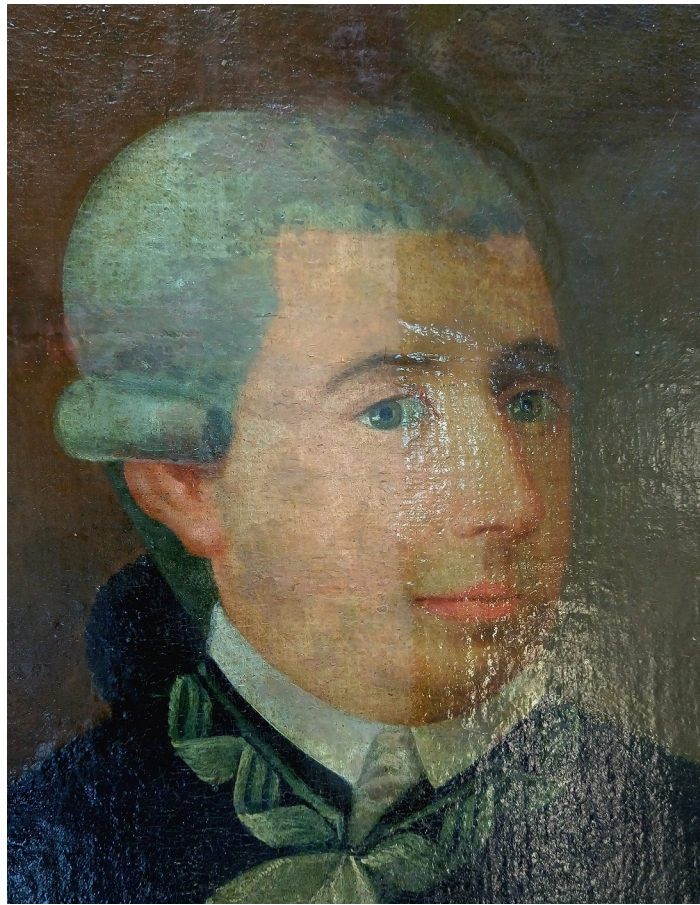
FIGURA 9 Remoción parcial del barniz en el rostro que deja al descubierto antiguos repintes.

El procedimiento para todos los sectores fue el de adelgazar el barniz con una disolución de etanol/ isooctano 40/60, y eliminar los repintes con la misma disolución. Se utilizó un gel preparado con Klucel G® y alcohol bencílico, y bisturí en los sectores donde se encontraban muy endurecidos los agregados. Una vez retirados los repintes, se estucaron los faltantes y se retocó con acuarelas. Finalizados los sectores, se procedió a barnizar a pincel con dammar al 5% en las zonas con retoques. Luego se aplicó el mismo barniz con una concentración del 10% emparejando los brillos en todo el cuadro (Fig. 10).